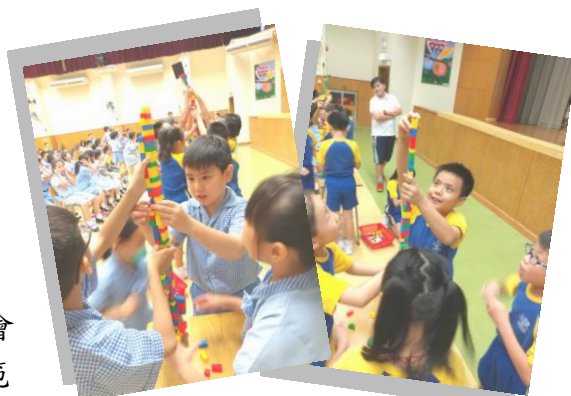
小三周會：合力砌高塔，體會群體合作，完成目標的意義。

以往周會分別以一二年級、三四年級及五六年級三大組別舉行，有鑑於各級學生人數多了，各年級學生的需要也各有不同，為了讓學生有更「貼身」的成長關顧，由本年度起，周會作出優化改動，六級均有自己的「級周會」，而整年周會主題圍繞著「德育培育」、「閱讀推廣」、「級本經營」三大範疇，編排適切學習內容及活動，期望可以加深學生之間、師生之間的情誼。